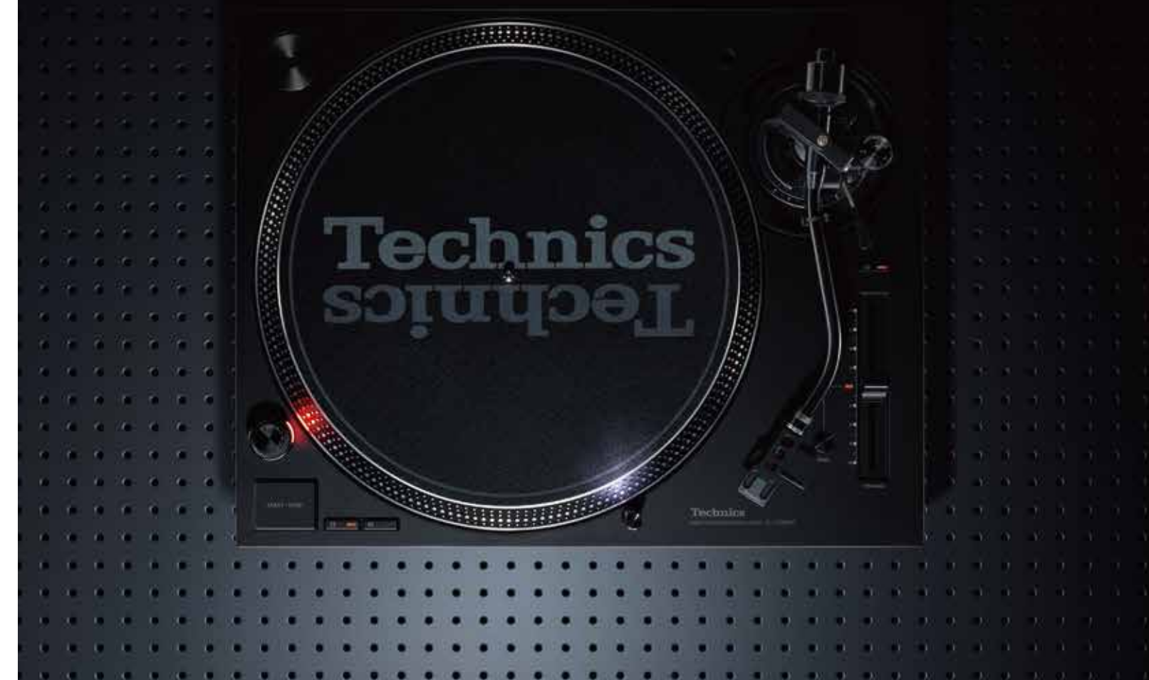
Sistema Giradischi a Trazione Diretta

Accessori Giradischi, Tappetino, Pannello, Coperchio antipolvere, Adattatore disco EP, Contrappeso, Portatestina, Set di viti per testina, Cavo PHONO, Cavo di messa a terra PHONO, Cavo di alimentazione CA, Manuale di istruzioni.